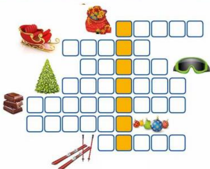
Krzyżówka Bożo Narodzeniowa